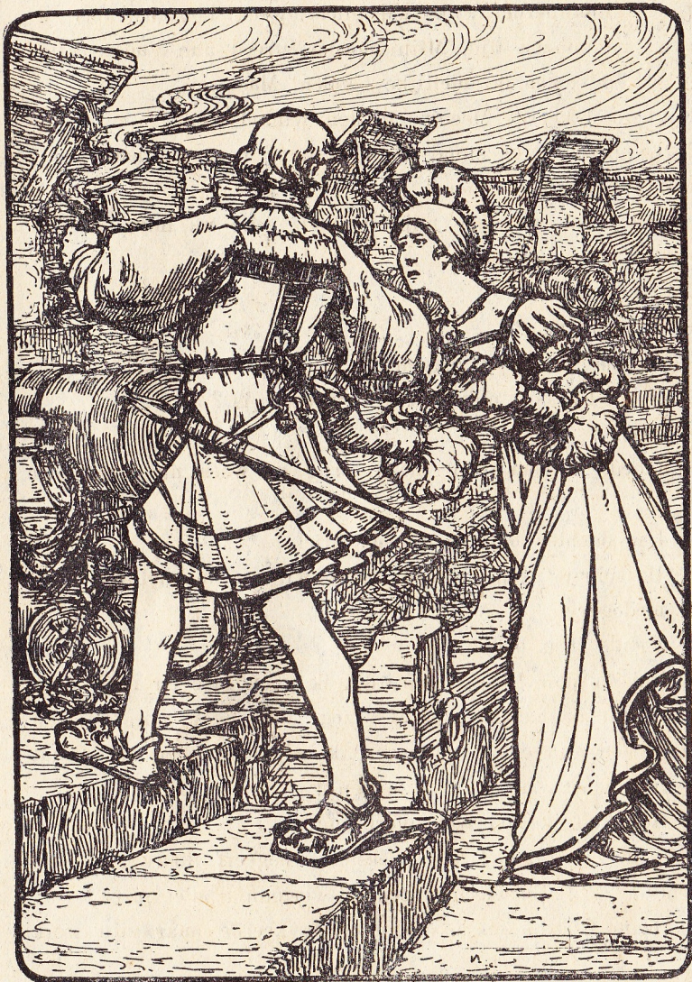
Mijne moeder streed aan vaders zijde.